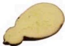
FM1145 900 g ca. Caciocavallo barricato BIO Abruzzo - mezza forma Formaggi.it