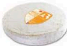
FM1037 1,7 kg Brie de Melun DOP Non Toccate mi il Formaggio