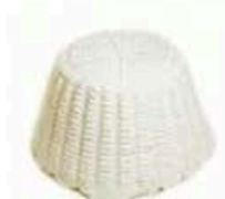
FM853 350 g Ricotta fresca BIO Puglia Querceta