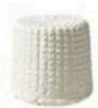
FM1003 130 g Giuncatina BIO Puglia Querceta