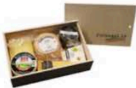
FSC212 1,25 kg Platò di Natale (disponibilità nov-dic) Formaggi.it