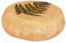
FM052 350 g Brebis Fougere MonS