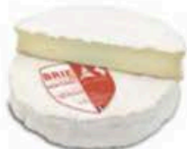
FM1039 1,1 kg Brie de Montereau Non Toccate mi il Formaggio