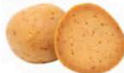
FM1802 1 kg Provola Piccador BIO Puglia Formaggi.it