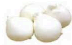
FM129 125 g Burratina Puglia Formaggi.it