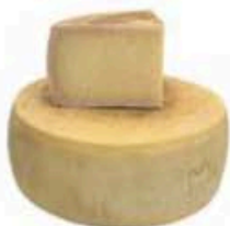
FM1018 1,5 kg Maiorchino Sicilia - spicchio Formaggi.it FM1017 17 kg ca. Maiorchino Sicilia - forma intera Formaggi.it