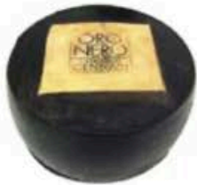
FM702 6 kg Oro Nero Ruota Emilia Romagna - mezza forma Formaggi.it