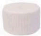
FM885 250 g ca. Cacioricotta vaccina BIO Puglia Querceta