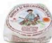
FSCI08 250 - 300 g Robiola di Roccaverano DOP Piemonte Formaggi.it