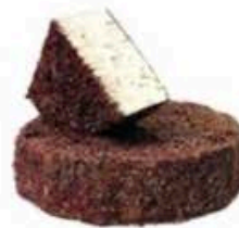
FM168 1,4 kg Blu di Bagnoli Veneto - spicchio Formaggi.it