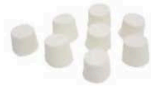
FM852 80 g Ricottine pugliesi Puglia Formaggi.it