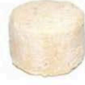
FM091 170 g Bonde du Poitou MonS