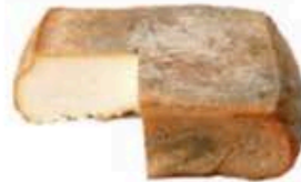
FM148 3 kg Sora stagionata Piemonte Formaggi.it