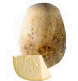
FM1822 1,6 kg Schiena d'asino giovane Campania - spicchio Formaggi.it