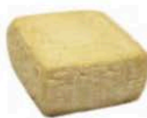
FM103 500 g Talè di capra Girgentana Sicilia Formaggi.it