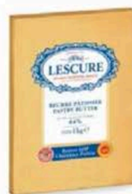
PA297 1 Kg Burro pasticceria 84% DOP Charente-Poitou Lescure