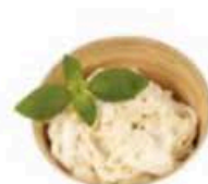
FM862 1 kg Stracciatella BIO Puglia Querceta