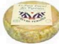
FM033 400 g Petit Fiancé Non Toccatemi il Formaggio