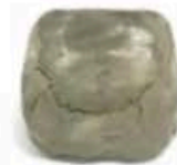
FSC123 500 g Argille di capra Puglia Formaggi.it