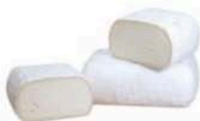
FM531 1,4 kg Casatica di bufala Lombardia Formaggi.it