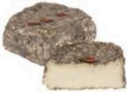
FM055 650 g Fromage du maquis MonS