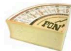
FM876 2,5 kg Fontina DOP di montagna Valle d'Aosta - spicchio Formaggi.it