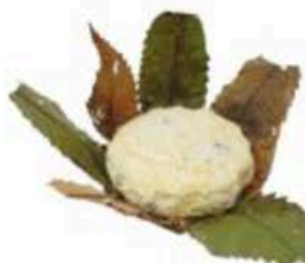
FSCI12 250 g Robiola in foglie di castagno Piemonte Formaggi.it