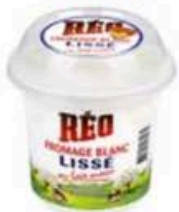
FM103 500 g Fromage Blanc Lissé