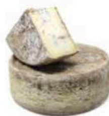
FM108 1,2 kg Strachitunt DOP Lombardia - spicchio Formaggi.it