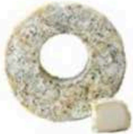
FM911 120 g Galette de l'Oiselliere MonS