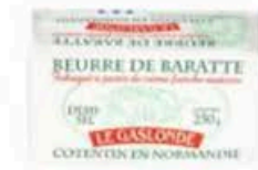
FM539 250 g Burro della Normandia demi-sel panetto