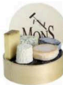
FM064 1 kg Plateau Cadeau 5 pezzi MonS