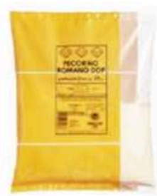
FGRO04 500 g Pecorino Romano DOP grattugiato Formaggi.it