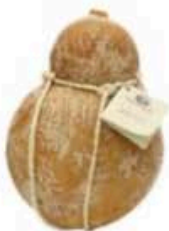
FM836 1,2 kg Caciocavallo stagionato in grotta BIO Puglia Querceta