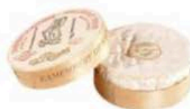
FM011 250 g Camembert de Normandie DOP Non Toccate mi il Formaggio