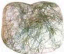
FM120 1 kg Sarass del fen (Seirass) Piemonte Formaggi.it