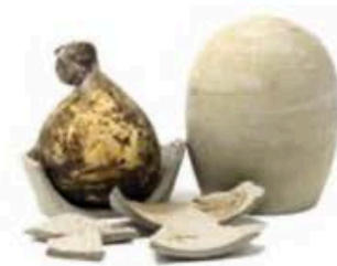
FM1824 800 g ca. Cocciuto in terra cruda Campania Formaggi.it