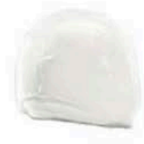
FM858 300 g Fiordilatte per pizza BIO Puglia Querceta