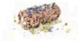
FM051 180 g Fiorito Veneto Formaggi.it