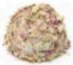
FM049 135 g Affienato alle rose Veneto Formaggi.it