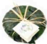
FSCI11 250 g Robiola in foglie di fico Piemonte Formaggi.it