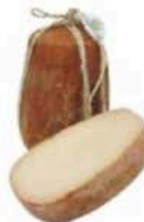
FM881 2,5 kg Provolone Riserva 12 mesi BIO Puglia - mezza forma Formaggi.it