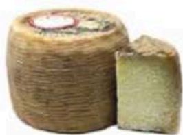
FSCI60 1,2 kg Pecorino Siciliano DOP stagionato Sicilia - spicchio Formaggi.it