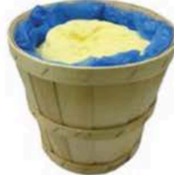
FM543 5 kg Burro della Normandia demi-sel cestello