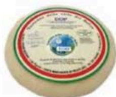
FM105 600 g Vastedda della Valle del Belice DOP - Sicilia Formaggi.it