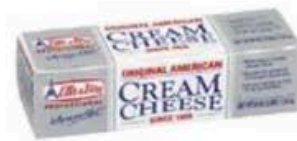
PA248 1,36 kg Cream Cheese Original American Elle&Vire