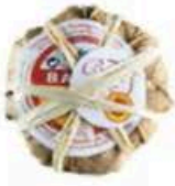
FM003 100 g Banon DOP (disponibilità feb-ott) MonS