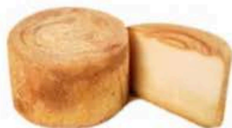
FM177 2,2 kg Castelmagno DOP Piemonte - mezza forma Formaggi.it