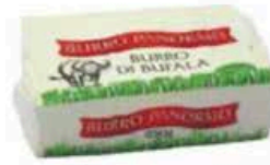
FM530 250 g Burro di Bufala