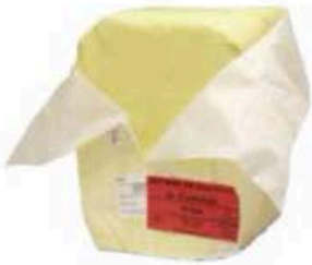
FM535 5 kg Burro della Normandia naturale blocco