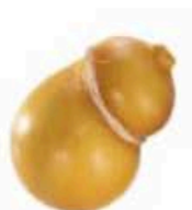
FM838 300 g Scamorza affumicata BIO Puglia Querceta