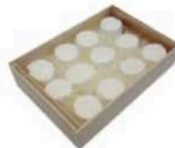
FM861 50 g Bouchon Piemonte Formaggi.it