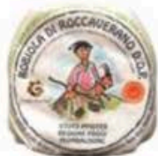
FSCI18 250 - 300 g Robiola di Roccaverano fresca DOP Piemonte Formaggi.it