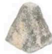
FM074 200 g Cabrioles MonS