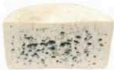
FM097 2,8 kg Bleu d'Auvergne Lait Cru DOP forma intera MonS