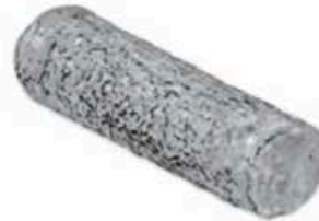
FM026 200 g Oiselliere (St. Maure) MonS