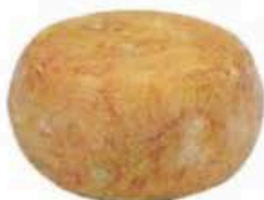
FM145 1,3 kg Pecorino di Pienza semistagionato Toscana Formaggi.it