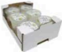
FM1742 130 g Ricotta BIO Puglia Querceta