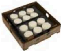
FM042 40 g Cabrettine Non Toccate mi il Formaggio