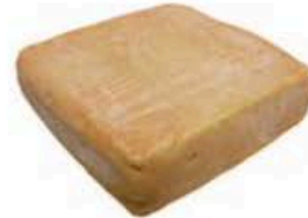
FM144 500 g Rubbia Valtaleggio Lombardia Formaggi.it