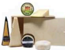
FSC215 1,25 kg Platò Non Toccatemi Il Formaggio Non Toccatemi il Formaggio