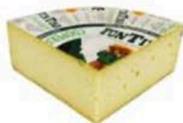
FM752 2,5 kg Fontina d'alpeggio DOP Valle d'Aosta - spicchio Formaggi.it