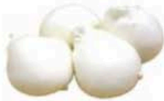
FM854 100 g Burratina BIO Puglia Querceta