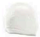
FM856 100 g Fiordilatte BIO Puglia Querceta