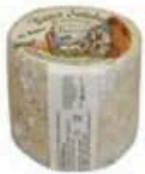
FM163 500 g Bianco sottobosco al tartufo Piemonte Formaggi.it