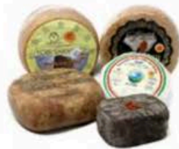
FSC248 1,9 kg Platò "Le isole del Mediterraneo" (disponibilità mag-set) Formaggi.it