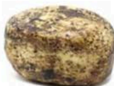
FMI142 1,2 kg Pientino morchiato alle olive Toscana Formaggi.it