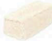
FM1009 180 g Lingot des Causses MonS