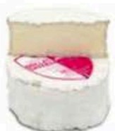
FM057 500 g Brillat-Savarin IGP Non Toccate mi il Formaggio