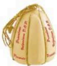
FM813 5 kg Provolone Valpadana DOP Mandarone piccante stagionato Veneto - spicchio Formaggi.it