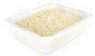
FM726 3 kg Fiordilatte cubettato per pizza Puglia Formaggi.it