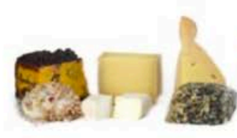
FSC243 1,9 kg ca. Platò degli affinatori Formaggi.it