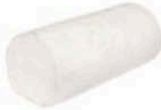
FM002 1 kg Buche de Chèvre MonS