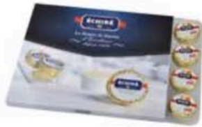
FM073 20 g Burro naturale Charentes - Poitou DOP Échiré