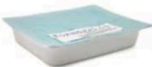
FM722 3 kg Ricotta di pecora da laboratorio Sardegna Formaggi.it