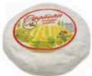
FM156 250 g Toma pagliettina tre latti Piemonte Formaggi.it