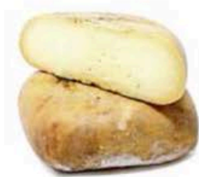
FM367 1,3 kg Mahon Menorca DOP mezza forma Olmeda Origenes