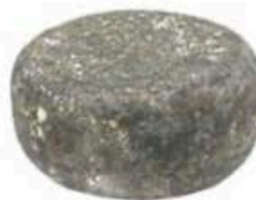
FM146 1,2 kg Pecorino di Pienza stagionato Toscana Formaggi.it