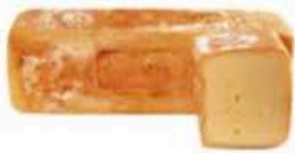
FM136 1 kg Ragusano DOP Sicilia - trancio Formaggi.it