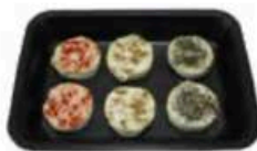
FM067 35 g Cabecou aromatizzati Non Toccate mi il Formaggio