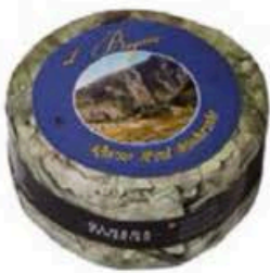
FM368 2,5 kg Azul de Cueva Olmeda Origenes