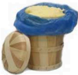
FM541 5 kg Burro della Normandia naturale cestello