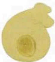
FM750 1 kg Provola delle Madonie con il limone BIO Sicilia - forma intera Formaggi.it