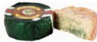
FM369 1,3 kg Cabrales DOP mezza forma Olmeda Origenes