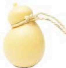
FM835 1,3 kg Caciocavallo semistagionato BIO Puglia Querceta