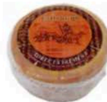
FM375 800 g La Serena Torta Extremeña Olmeda Origenes