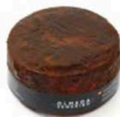
FM374 1,5 kg Queso Canario Olmeda Origenes