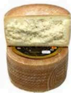
FM377 1,4 kg Manchego artesano Gran Reserva DOP Dehesa de los Llanos mezza forma Non Toccatemi il Formaggio