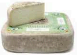
FM125 1,1 kg Raschera DOP di montagna Piemonte - spicchio Formaggi.it