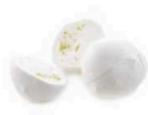
FM1724 125 g Mozzarella di Bufala Campana DOP per pizza Campania Formaggi.it