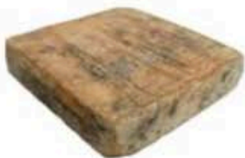
FM143 1,8 kg Stracchino all'antica delle Valli Orobiche Lombardia Formaggi.it