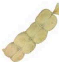
FM142 1,3 kg Pecorino infossato Emilia Romagna Formaggi.it