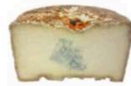
FM880 2 kg Castelmagno d'alpeggio DOP 2021 Piemonte - mezza forma Formaggi.it