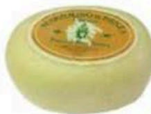
FM710 600 g Marzolino Toscana (disponibilità mar-apr) Formaggi.it