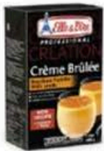
PA243 1 l Crème brûlée con Vaniglia Bourbon del Madagascar Elle&Vire