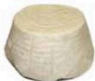
FM102 300 g Ricotta al fumo di ginepro BIO Abruzzo Formaggi.it