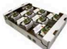
FM1731 125 g Mozzarella di Bufala Campana DOP Campania Formaggi.it