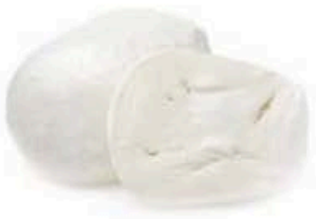
FM1727 300 g Mozzarella fiordilatte per pizza Puglia Formaggi.it