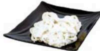
FM728 2 kg Stracciatella Puglia Formaggi.it