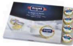
FM072 20 g Burro demi-sel Charentes - Poitou DOP Échiré