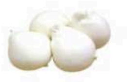
FM855 100 g Burratina per pizza BIO Puglia Querceta