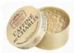
FM009 200 g Affiné au Chablis Non Toccate mi il Formaggio