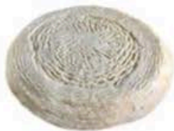
FM106 650 g Gregoriano pasta molle BIO Abruzzo Formaggi.it