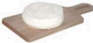
FM863 1 kg Squacquerone di Romagna DOP Emilia Romagna Formaggi.it