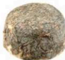
FM104 1 kg Ricotta scorza nera BIO Abruzzo Formaggi.it