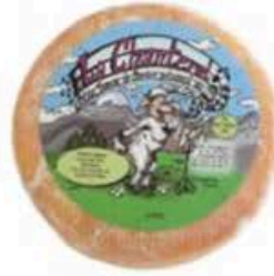
FM297 1,3 kg Chanteral Non Toccate mi il Formaggio