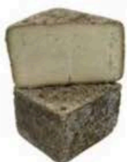
FM914 2 kg Blu di bufala Lombardia - mezza forma Formaggi.it