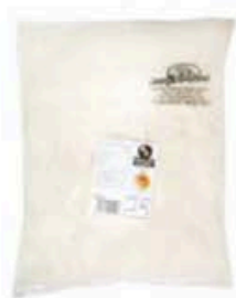
FGRO21 1 kg Parmigiano Reggiano DOP grattugiato Formaggi.it