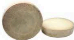
FM141 2,7 kg Pecorino di Pienza "riserva" Toscana - mezza forma ruota Formaggi.it