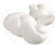
FM801 100 g Treccina Fiordilatte Puglia Formaggi.it