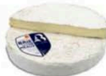
FM1038 3 kg Brie di Meaux DOP Non Toccate mi il Formaggio