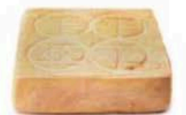
FM150 2 kg Taleggio DOP Lombardia Formaggi.it