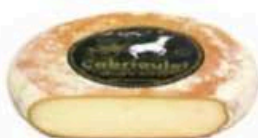
FM031 2,5 kg Cabrioulet Non Toccate mi il Formaggio