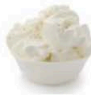
FM101 500 g Mascarpone artigianale Emilia Romagna Formaggi.it