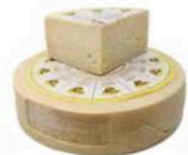
FM121 1,25 kg Carnia stagionato Friuli-Venezia Giulia - spicchio Formaggi.it