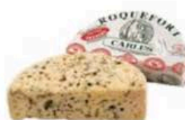
FM025 650 g Roquefort DOP J. Carles Non Toccate mi il Formaggio