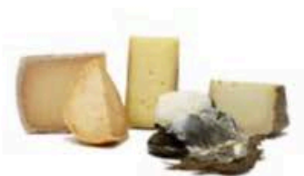
FSC239 1,4 kg Platò dei formaggi agricoli Formaggi.it