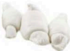
FM734 50 g Nodino Fiordilatte Puglia Formaggi.it