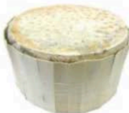
FM112 1,5 kg Gorgonzola dolce DOP Piemonte - spicchio Formaggi.it