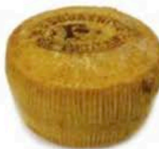
FM821 4,5 kg Pecorino di Filiano DOP Basilicata Formaggi.it