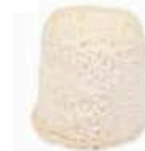
FM093 150 g Chabichou du Poitou DOP MonS