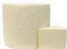
FM134 1,5 kg Pecorino Romano DOP Sardegna - spicchio Formaggi.it