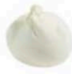
FM869 50 g Mini burratina BIO Puglia Querceta