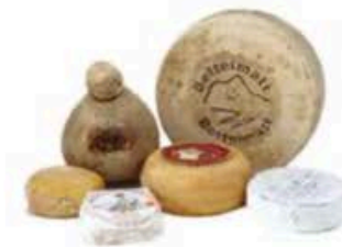
FSC249 3 kg Platò della Primavera (disponibilità mar-giu) Formaggi.it