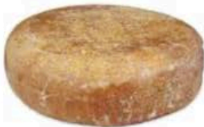
FMI096 2,2 kg Pyrénées Brebis - mezza forma MonS