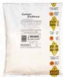
FGRO11 500 g Grana Padano DOP grattugiato Formaggi.it