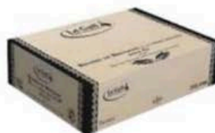
FM572 10 kg Burro di Bretagna naturale blocco