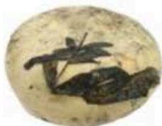
FM144 1,2 kg Pecorino di Pienza stagionato in foglie di noce Toscana Formaggi.it