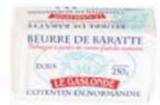
FM536 250 g Burro della Normandia naturale panetto