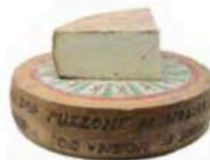
FM859 2 - 2,3 kg Puzzone di Moena DOP - 150 gg Trentino - spicchio 1/4 di forma Formaggi.it