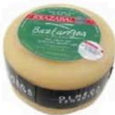
FM370 1 kg Idiazabal DOP Olmeda Origenes