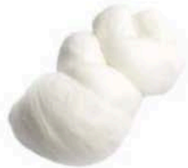
FM733 1 kg Treccia Fiordilatte Puglia Formaggi.it