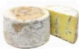
FM181 2,5 kg Blu della Lessinia Veneto Formaggi.it