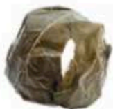
FM746 300 g Ficu Sicilia Formaggi.it