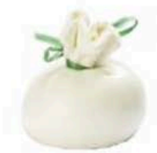
FM736 300 g Burrata tradizionale Puglia Formaggi.it