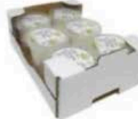
FM1743 150 g Stracciatella BIO Puglia Querceta