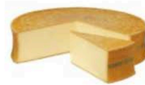
FM068 1,6 kg ca. Beaufort DOP spicchio MonS