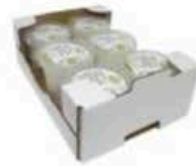
FM1741 100 g Fiordilatte BIO Puglia Querceta