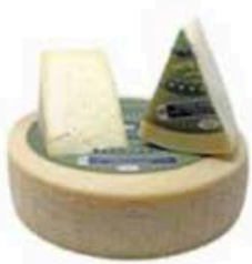
FM793 1,5 kg Monte Veronese fresco DOP Veneto - spicchio Formaggi.it