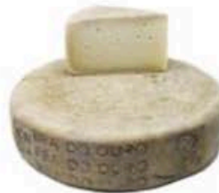
FM127 800 g Bra duro d'alpeggio DOP Piemonte - spicchio Formaggi.it