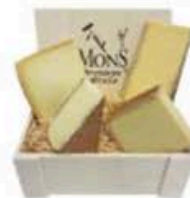
FM065 1,2 kg Plateau Tunnel de la Collonge MonS