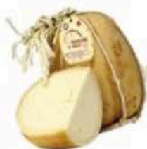
FMI35 3 - 3,5 kg Provolone del Monaco DOP Campania Formaggi.it