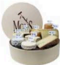
FM062 1,9 kg Plateau 10 pezzi MonS