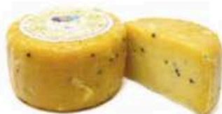
FSCI62 1,6 kg Piacentinu ennese DOP Sicilia - mezza forma Formaggi.it