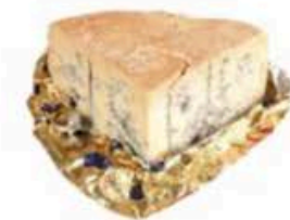
FM151 1,3 kg Gorgonzola piccante DOP Piemonte - spicchio Formaggi.it