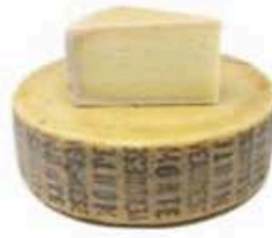
FM137 900 g Monte Veronese di malga DOP Veneto - spicchio Formaggi.it