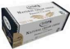
PA850 1 kg Natural Cream Cheese