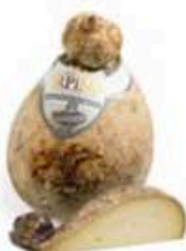
FM1823 2,1 kg Caciocavallo Irpino di grotta Campania Formaggi.it