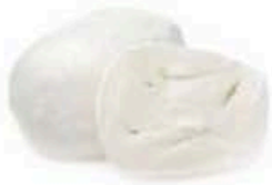
FM732 100 g Fiordilatte Puglia Formaggi.it