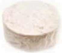
FM167 400 g Bianco di Montegalda BIO Veneto Formaggi.it