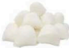
FM739 30 g Ciliegine Fiordilatte Puglia Formaggi.it