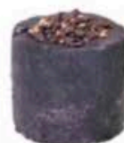
FM165 600 g Testun al Barolo Piemonte Formaggi.it