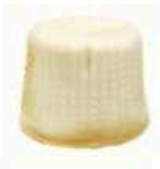
FM1747 125 g Burratina Affumicata BIO Puglia Querceta