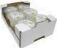
FM1744 125 g Treccina BIO Puglia Querceta