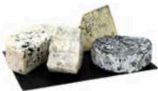
FM700 2,3 kg Platò erborinati d'Europa Non Toccatemi il Formaggio