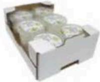
FM1740 100 g Burratina BIO Puglia Querceta