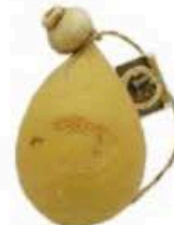
FSCI30 2 kg Caciocavallo Podolico Puglia Formaggi.it