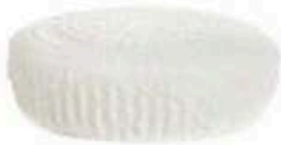
FM874 600 g Ravaggiolo Emilia Romagna Formaggi.it