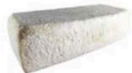
FM898 3,5 kg Lingotto di Predazzo Trentino Formaggi.it