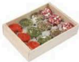
FM860 50 g Bouchon aromatizzati Piemonte Formaggi.it