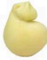
FM742 1 kg Provola delle Madonie BIO Sicilia Formaggi.it