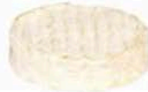
FMI023 150 g Perail MonS