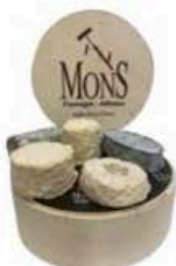
FM071 800 g Plateau centrotavola Chèvre MonS