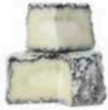
FM1016 80 g Crottin Cendrée MonS