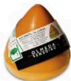
FM364 1 kg San Simón Da Costa Olmeda Origenes