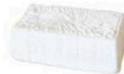
FM802 1,3 kg Giuncata Puglia Formaggi.it