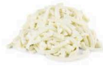
FM1726 3 kg Fiordilatte julienne per pizza Puglia Formaggi.it