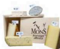
FM061 1 kg Plateau Hervé MonS Christmas edition (disponibilità dicembre) MonS