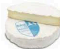
FM1040 1,1 kg Brie de Nangis Non Toccate mi il Formaggio