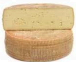
FM910 2,2 kg Formai de Predacia Trentino - mezza forma Formaggi.it