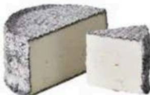
FM1008 1,5 kg Tomme de Chambrille MonS