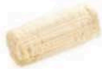
FM724 200 g Ricotta misto pecora da grattugia Basilicata Formaggi.it