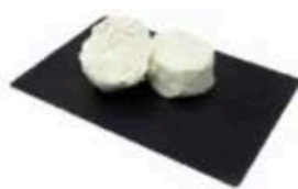
FM171 190 g Caprino fresco di pura capra BIO Veneto Formaggi.it