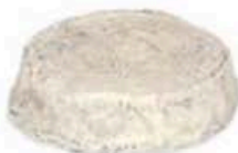
FM012 150 g Couffy MonS