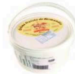
FM538 2 l Crème Fraîche épaisse 42% (Panna di latte acidificata)