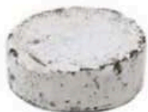
FM161 500 g Blu di Morozzo Piemonte Formaggi.it