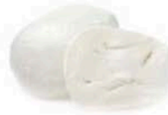
FM864 300 g Fiordilatte pizza Puglia Formaggi.it