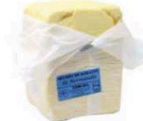
FM537 5 kg Burro della Normandia demi-sel blocco