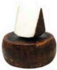
FM843 1 kg Masseria Pugliese Puglia - spicchio Formaggi.it