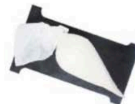
FM872 1 kg Seirass reale (ricotta misto pecora - vacca) Piemonte Formaggi.it