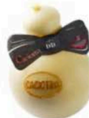
FM1820 1,1 kg Caciotta Irpino Campania Formaggi.it