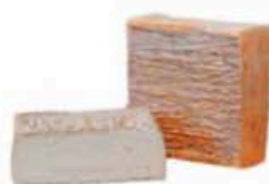
FM532 2,2 kg Quadrello di bufala Lombardia Formaggi.it