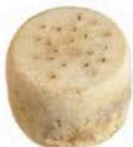
FM169 750 g Monteverde BIO Veneto Formaggi.it