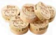
FM043 125 g Pico chèvre Non Toccatemi il Formaggio