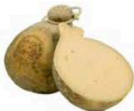
FSCI37 1,8 kg Caciocavallo Podolico riserva Puglia Formaggi.it