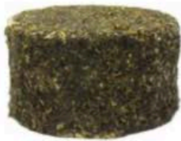
FSCI45 2,3 - 2,7 kg Blu della Daunia Puglia Formaggi.it