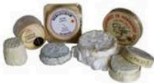
FM001 1 kg ca. Plateau Formaggi Francesi Non Toccate mi il Formaggio